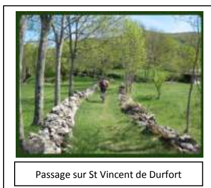
Passage sur St Vincent de Durfort