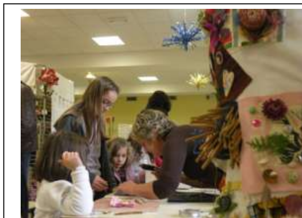
L'atelier « Habillez la mariée » animé par les bénévoles de l'Effet Froufrou lors de la Semaine Européenne de Réduction des Déchets organisée par la Ressourcerie Trimaran