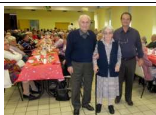
Mr le Maire et les doyens

Le repas préparé par l'Auberge de la Soie et servi comme à l'accoutumée par les conseillers municipaux et leurs conjoints a été agrémenté de chants et d'histoires drôles.